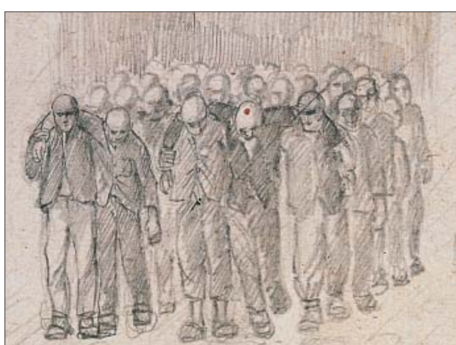
»Zugang« / "Arrival" Grafik: Vlastimir Kopáč, (1944/45 Häftling im KZ Dachau), Muzej novejšje zgodovine Slovenije, Ljubljana

Zu den Gefangenen zählten politische Gegner des NS-Regimes, Juden, Sinti und Roma, Homosexuelle, Zeugen Jehovas und Menschen, die die Nationalsozialisten als »Asoziale« oder »Kriminelle« verfolgten. Während des 2. Weltkrieges (1939 - 1945) hielt die SS schließlich Häftlinge aus allen Ländern Europas im KZ Dachau gefangen.