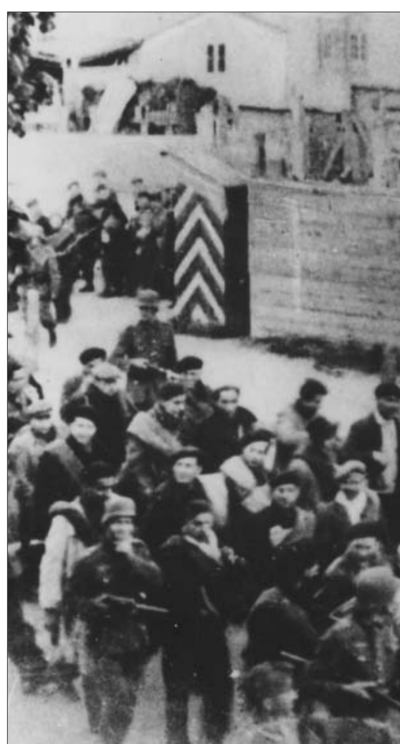
Häftlingstransport vom Lager Compiègne ins KZ Dachau. Prisoner transport from the Compiègne camp to the Dachau concentration camp.

Über 200.000 Menschen wurden zwischen 1933 und 1945 ins KZ Dachau und seine Außenlager verschleppt. Die Gefangenen kamen zum Teil hier unmittelbar am Dachauer Bahnhof an. Vor den Augen der Zivilbevölkerung trieben SS-Männer die Häftlinge weiter zum Konzentrationslager.