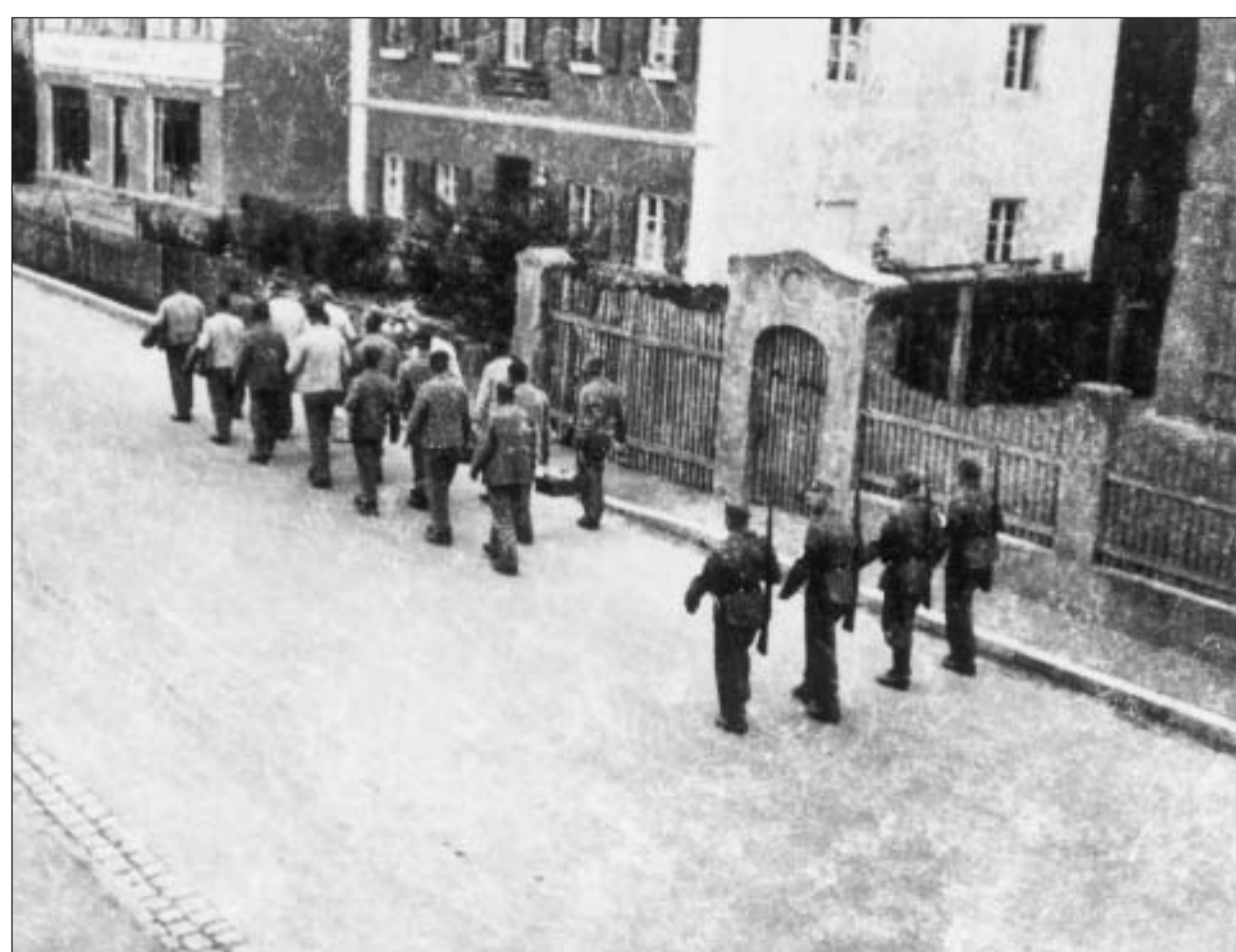
Häftlinge marschieren durch Dachau zur Arbeit Prisoners march through Dachau on their way to work Illegales Foto 1933/34, KZ-Gedenkstätte Dachau

Wiederholt wurden KZ-Häftlinge zu Zwangsarbeiten auch in der Stadt Dachau eingesetzt. Bis 1938 mussten Gefangene die öffentlichen Straßen in unmittelbarer Nachbarschaft des KZ-Geländes ausbauen: