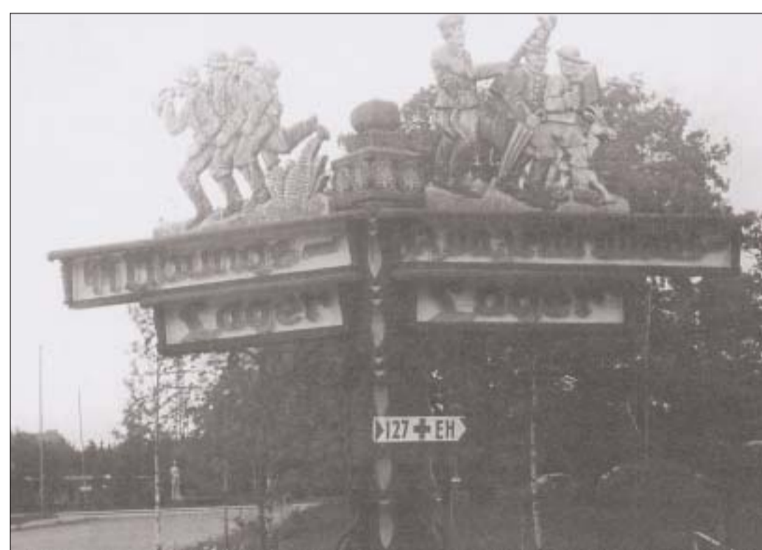
Wegweiser mit antisemitischen Karkikaturen Signpost with anti-Semitic caricatures

Here signposts with anti-Semitic caricatures indicated the two sections of the Dachau camp grounds: