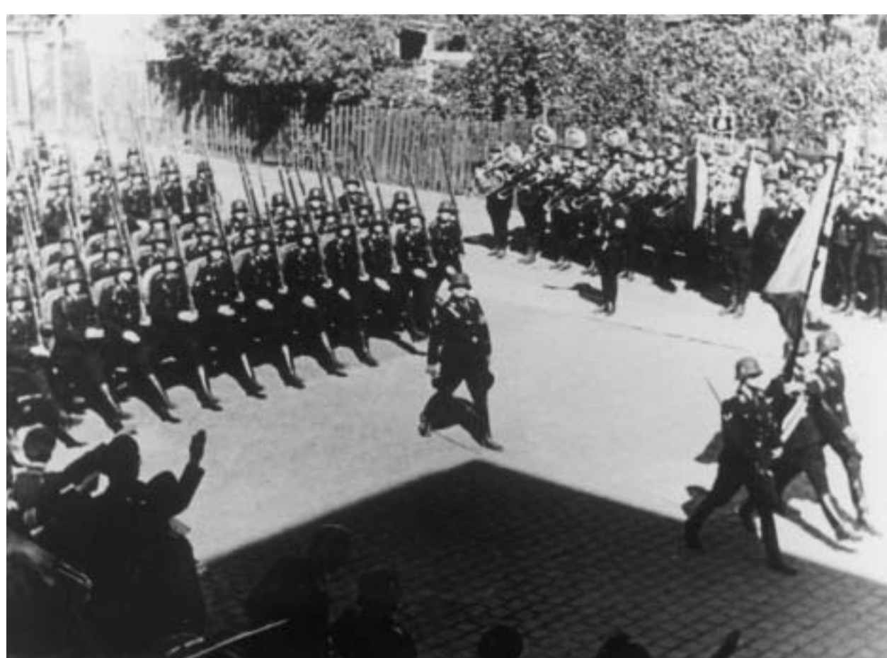
SS-Totenkopfverbände marschieren durch Dachau SS 'Death's Head' divisions marching through Dachau

Während des Krieges wurde die im KZ Dachau ausgebildete SS-Totenkopfdivision als militärische Eliteeinheit und Polizeitruppe eingesetzt, ihre Angehörigen trugen die Verantwortung für zahlreiche Verbrechen an der Zivilbevölkerung der besetzten Länder. Der Einsatzort wechselte ständig. KZ-Wachmannschaften versetzte die SS an die Front, während fronttaugliche Waffen-SS-Angehörige den Dienst im KZ antraten.