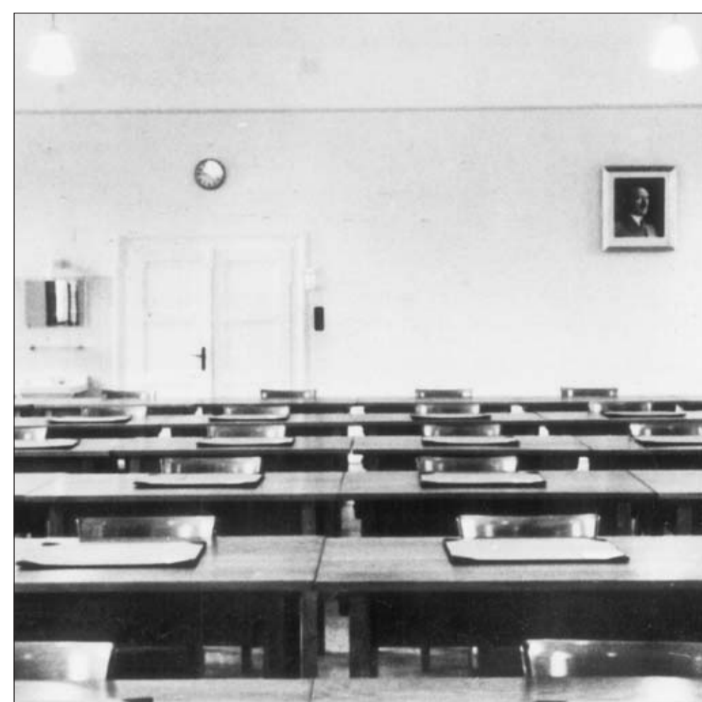
Führerschule im SS-Übungslager Cadre school in the SS drill camp

Foto: SS, etwa 1937, Bundesarchiv Berlin