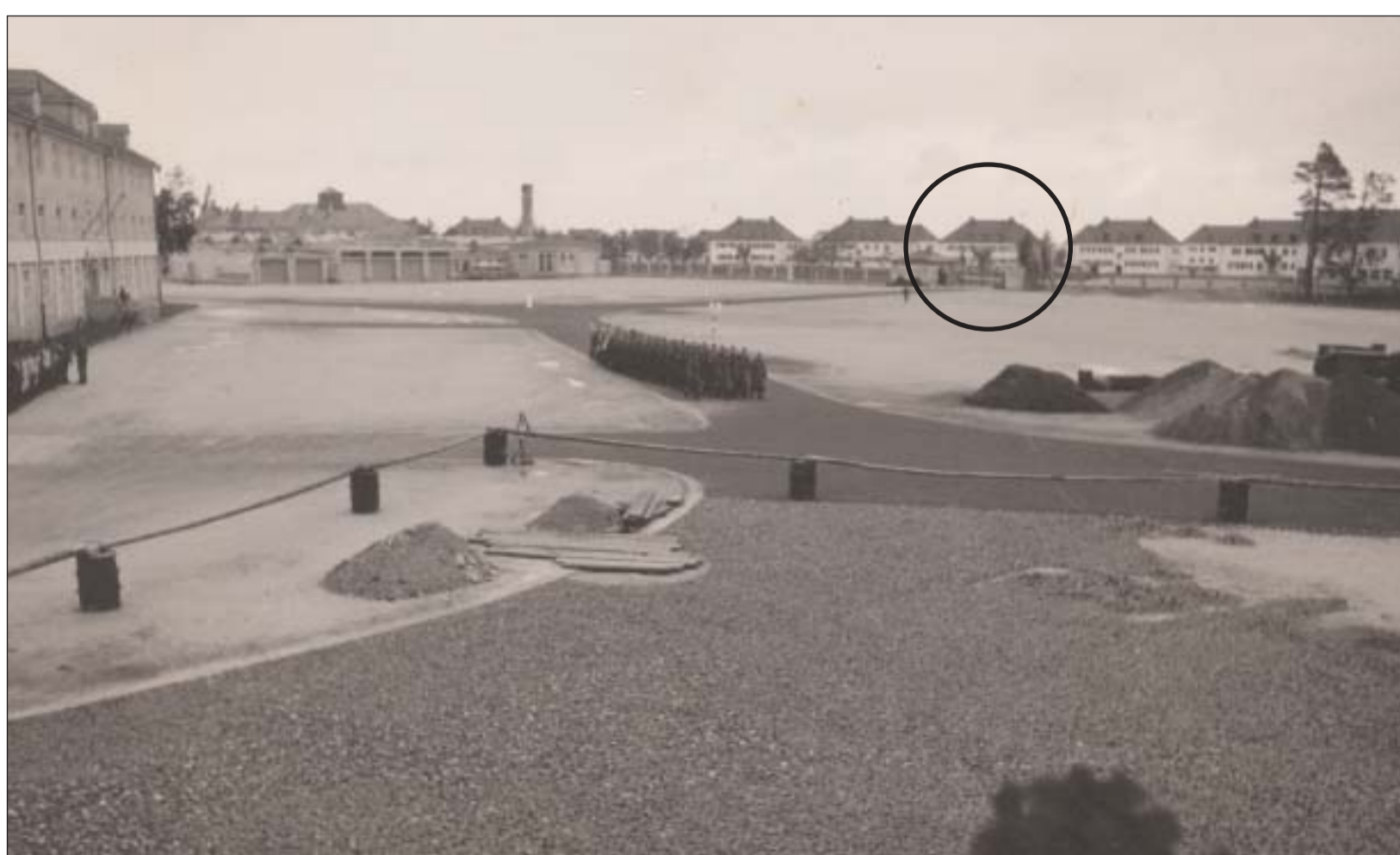
Eingang SS-Übungslager / Entrance to the SS drill camp