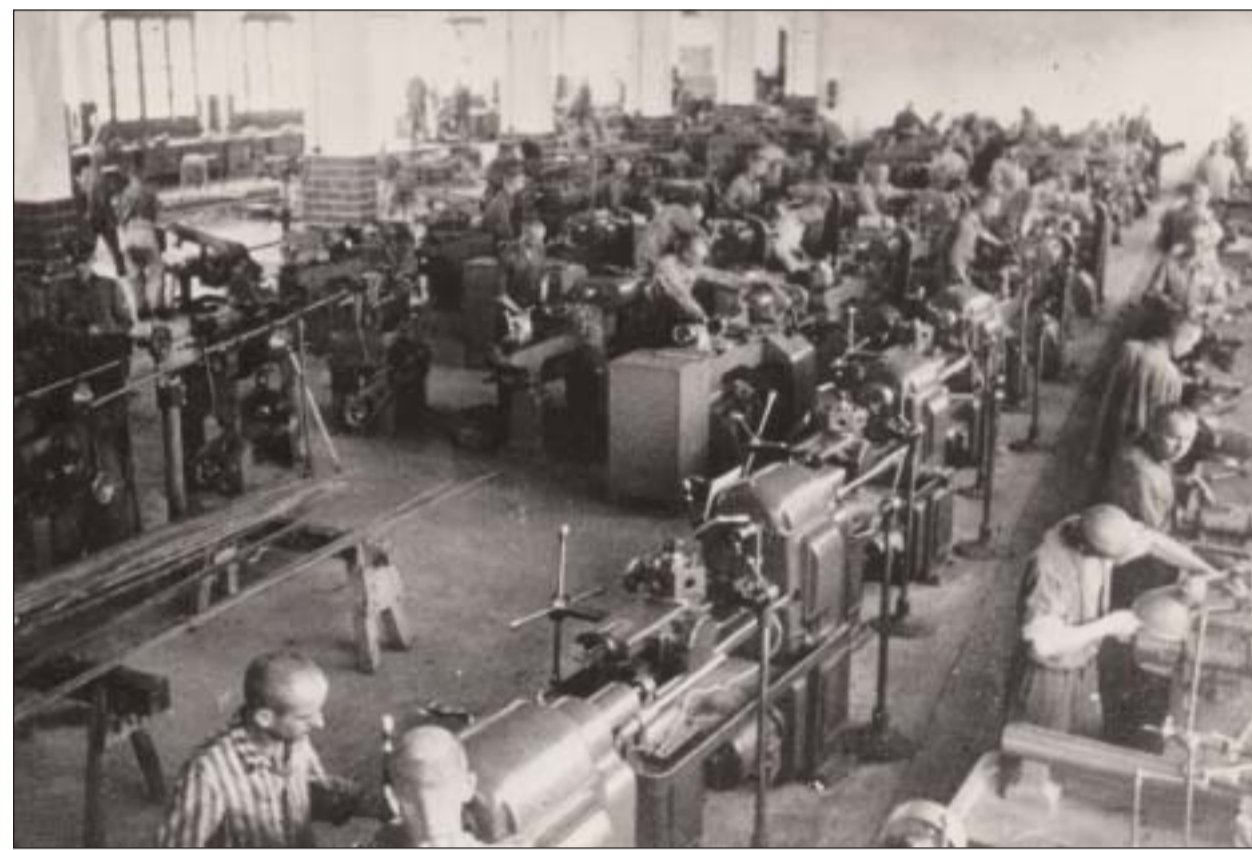
Häftlinge in der Schlosserei / Prisoners in a metalworking shop

Heute nutzt die Bayerische Bereitschaftspolizei das Gebäude. Zwei weitere, noch größere Fabrikbauten wurden in den 1980er Jahren abgerissen und zu einem Erdwall angehäuft, um die Polizei auf dem ehemaligen SS-Gelände vor den Blicken der Gedenkstättenbesucher abzu-schirmen.